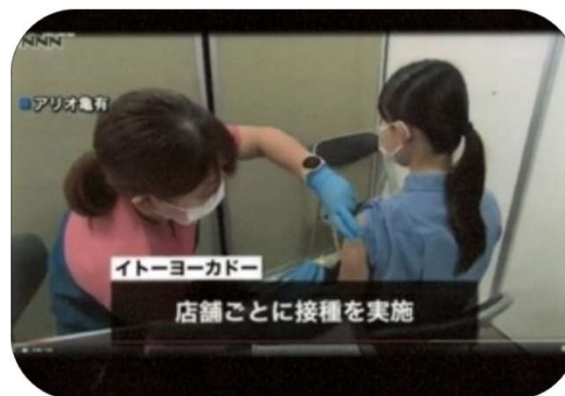
ワクチン企業接種